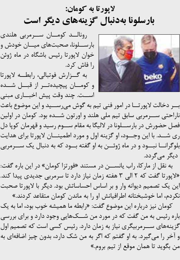
رونالد کومان سرمربی هلندی بارسلونا،صحت‌های میان خودش و خوان لاپورتا رئیس باشگاه در ماه ژوئن را فاش کرد.

پی اس جی امیدوار است که با قراردادی که با شرکت «کریپتو دات کام» امضا کرده بتواند از این ارز مجازی سالی ۲۵ تا ۳۰ میلیون یورو درآمدزایی کند.