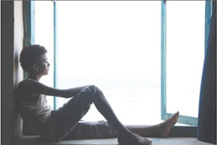
بازیگران فیلم «اقیانوس پشت پنجره» در حال تمرین