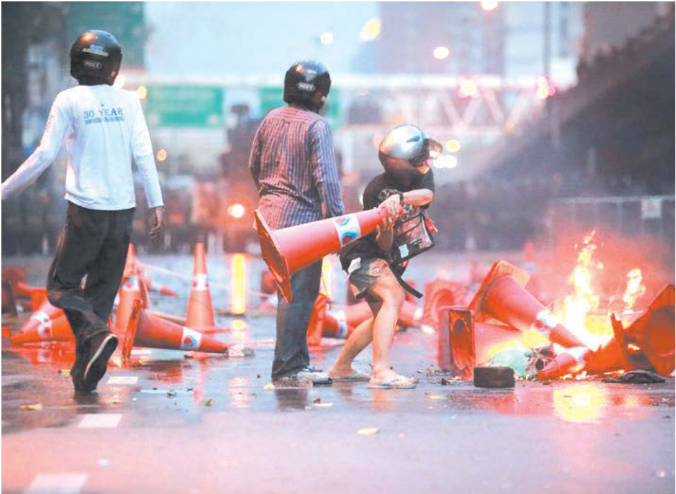
اعتراضات علیه سوء مدیریت حکومت در مهار همه گیری ویروس کرونا در شهر بانکوک تایلند